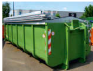
Fliptop Gear: met handbediening, geschikt voor containers tot 6 meter