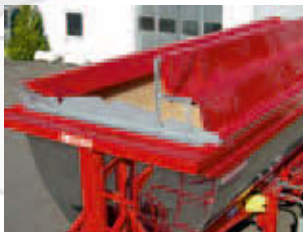
Fliptop Multi: opent vanuit het midden naar twee zijden